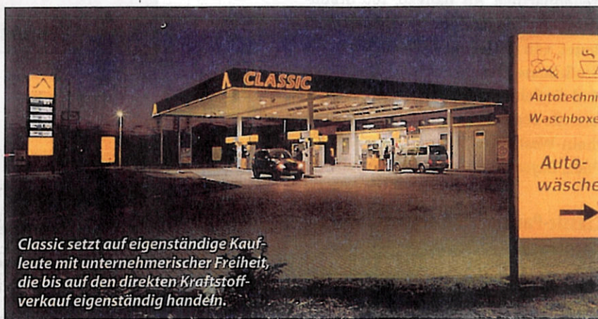
Classic setzt auf eigenständige Kaufleute mit unternehmerischer Freiheit, die bis auf den direkten Kraftstoffverkauf eigenständig handeln.

In unserer August- und September-Ausgabe haben wir Sie gebeten darüber abzustimmen, welche Mineralölgesellschaft die beste ist. Das Ergebnis liegt jetzt vor, und wir bedanken uns für Ihre Teilnahme. Hier nun die Gewinner und die Ergebnisse im Detail.