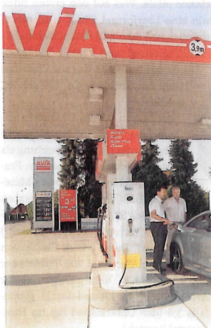
Auch wenn das Avia-Netz in Deutschland 800 Stationen umfasst, die Marke ist sehr auf regionale Verbundenheit und individuelle Kundenbetreuung ausgerichtet.

Die Verbreitung in den Süden der Republik verdankt das Unternehmen der Classic Mineralöl Rhein-Hessen GmbH & Co. KG, die seit 1. Mai 2010 zur Lühmann-Gruppe gehört. Was die Classic-Tankstellen für unsere Leser in erster Li-