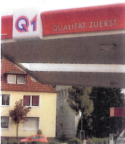
Q1 ist mit seinen 165 Tankstellen in Nord- und Westdeutschland sowie Mitteldeutschland vertreten und zählt zu den 100 größten Unternehmen in Niedersachsen.

Erfreulich war bei unserer Umfrage, dass sich zum ersten Mal auch die Pächter von A-Gesellschaften rege beteiligt haben. Spitzenreiter waren allerdings die Partner von Tamoil auf dem vierten Platz, von denen 44 an unserer Leserbefragung teilnahmen. Hans Rongisch